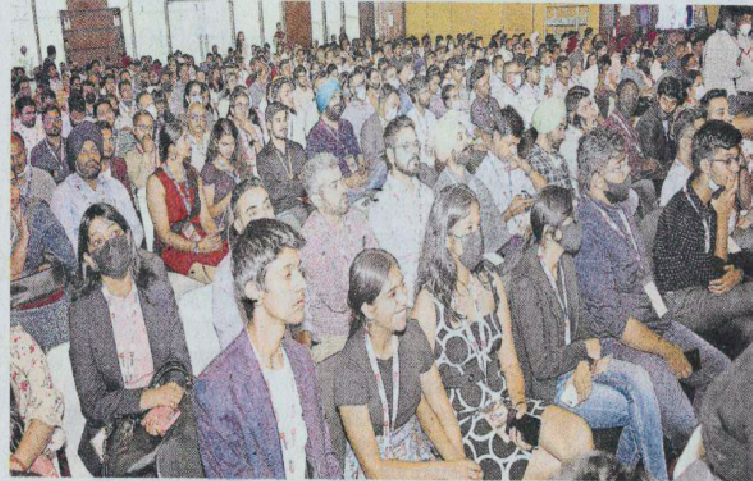
चंडीगढ़ : शनिवार को आयोजित टाइकॉन-2022 में बड़ी संख्या में युवाओं ने शिकरत की जागरण

ग्रोवर से जब पूछा गया कि उन्हें इतना गुस्सा क्यों आता है तो उन्होंने कहा कि यह उनका नेचुरल स्टोइल है। वह बनावटी तरीके से खुद को नहीं रख सकते। ग्रोवर ने कहा कि