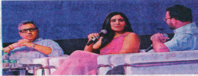
टाइकॉन 2022 में उद्यमियों को टिप्स देते शार्कटैंक के जज।

ट्राईसिटी में मौजूदा स्टार्ट-अप इकोसिस्टम को कोविड के बाद पुनर्जीवित करने के उद्देश्य से टाइकॉन 2022 का आयोजन किया गया। टाइकॉन के 7वें एडिशन में कोविड से प्रभावित बिजनेस को अत्यधिक जोर, तालमेल और प्रोत्साहन प्रदान करने के प्रयास किया गया। पंजाब के वित्त मंत्री सरदार हरपाल सिंह चीमा ने टाइकॉन का शुभारंभ किया। एक दिवसीय आयोजन में शार्कटैंक इंडिया के जज बिलियनर अशनीर ग्रोवर और गजल अलघ सहित कई जाने माने बिजनेस लीडर्स ने स्टार्टअप को टिप्स, स्किल सेट और चुनौतियों के बारे में बताया। महिला उद्यमी, सह संस्थापक और सीआईओ मामाअर्थ गजल अलघ ने कहा कि भारत में संपन्न स्टार्टअप इको सिस्टम को देखकर खुशी हो रही है। अब हमारे पास बहुत सारे यूनिकॉर्न हैं जिन्होंने तीन से छह साल की अवधि में इस छलांग को पार कर लिया है। सलाह, शिक्षा और इन्क्यूबेशन के साथ अब आने वाले यूनिकॉर्न के लिए इस स्तर पर पहुंचने की समय सीमा और भी कम होगी। अलघ ने कहा कि 'मुझे