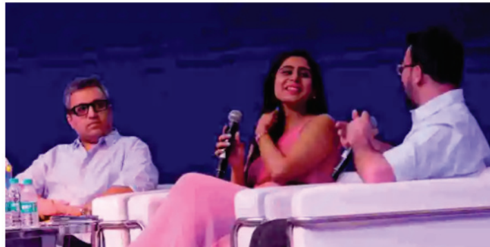
Shark Tank India fame Ashneer Grover along with Ghazal Aleph during the inaugural discussion at TIECON2022 here today at Hyatt Regency, Chandigarh