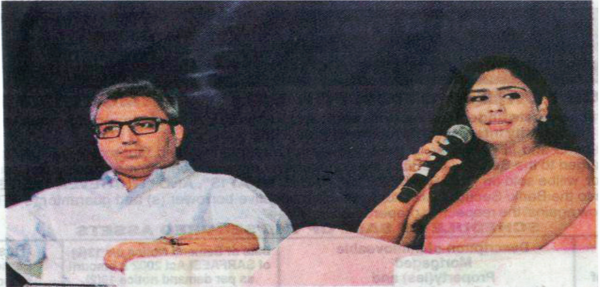
Shark Tank India's Ashneer Grover and Ghazal Alagh during TiECon 2022 in Chandigarh on Saturday.