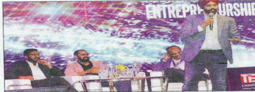
Speakers deliberating upon facets of business at TIECON 2022

Punjab, Haryana and Chandigarh from different sectors such as Information Technology, Artificial Intelligence, Robotics, Education, e-commerce, co-work space etc shared notes at the “Start Up Bazaar” event.