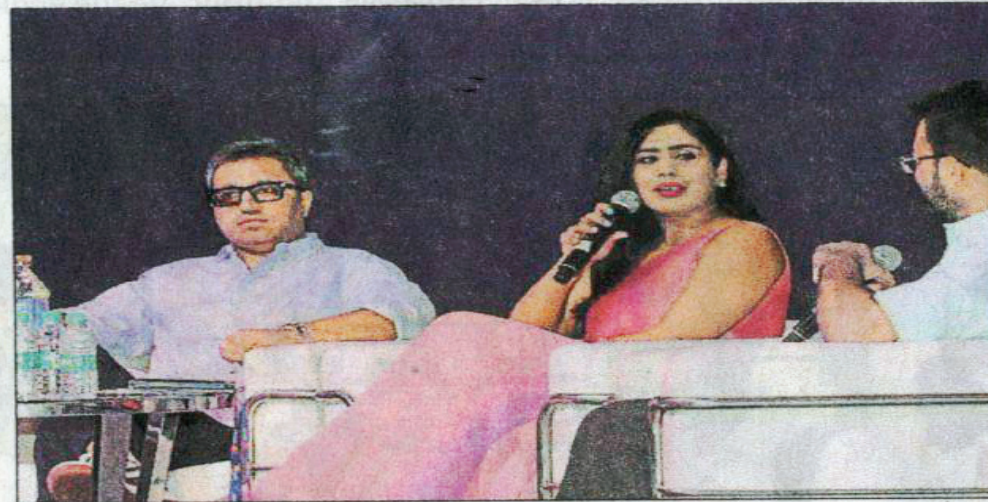
Prominent entrepreneurs Ashneer Grover and Ghazal Alagh (right) during the panel discussion at TieCON 2022 in Chandigarh on Saturday.

"I am sure the next heroes of the country will be entrepreneurs, who cherish the idea of making a change in customers' lives by offering them greater choices," the Mamaearth