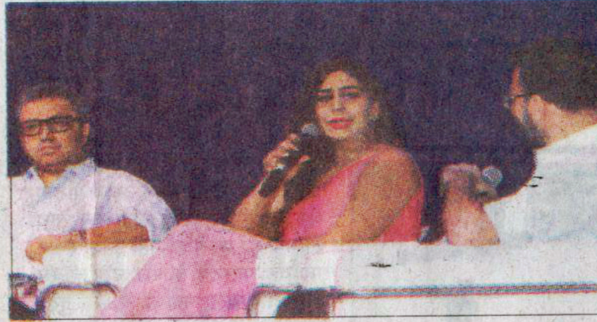
शार्क टैंक इंडिया के जज बिलियनर अशनीर ग्रोवर और गजल अलघ टाइकॉन चर्चा में सवाल के उत्तर देते हुए।

पैनल डिस्कशन में को-जज गजल अलघ के साथ बातचीत के दौरान भारत पे के सह-संस्थापक, जिन्हें कंपनी से बेदखल कर दिया गया था, ने कहा कि उनकी अगली चुनौती अब किसी भी निवेशक के पास नहीं