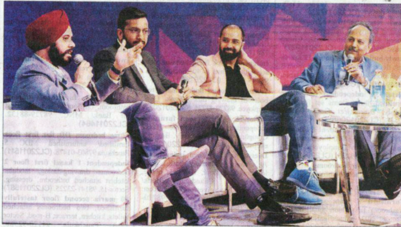
Speakers during the TIECon in Chandigarh on Saturday.